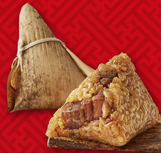
角煮入り中華ちまき(1個) 310円(税込341円)