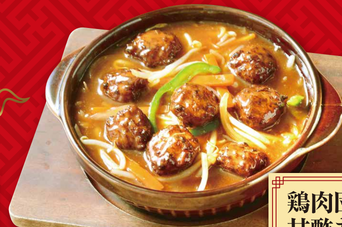
鶏肉団子の 甘酢あんかけ 710円(税込781円)