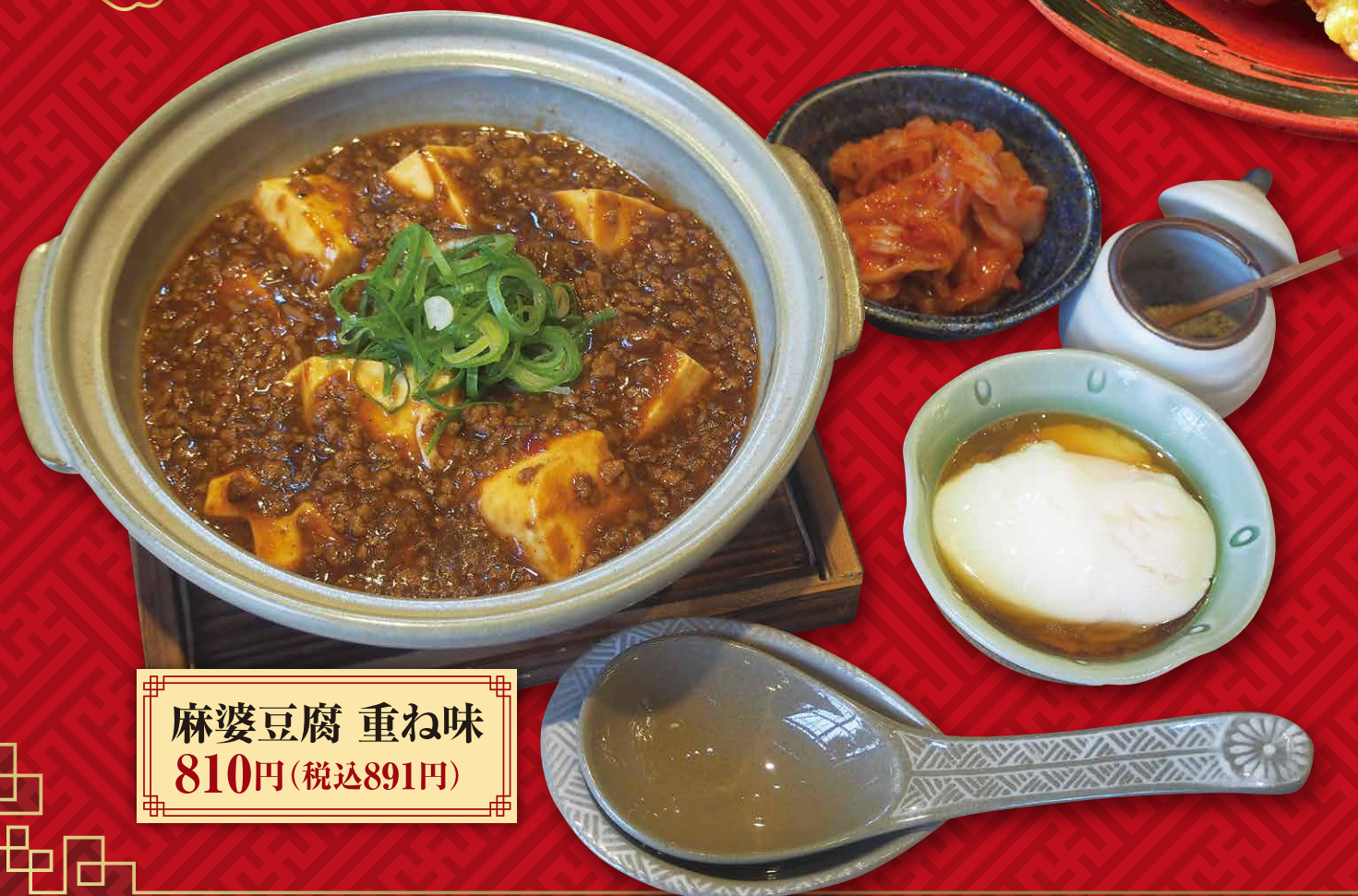
麻婆豆腐 重ね味 810円(税込891円)