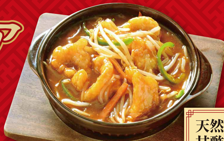
天然海老の 甘酢あんかけ 780円(税込858円)