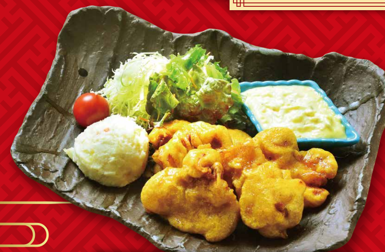
自家製タルタルソースの チキン南蛮 890円(税込979円)