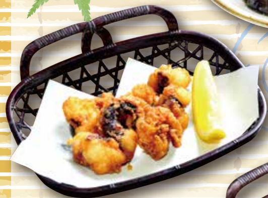
たこのから揚げ 590円 (税込649円)