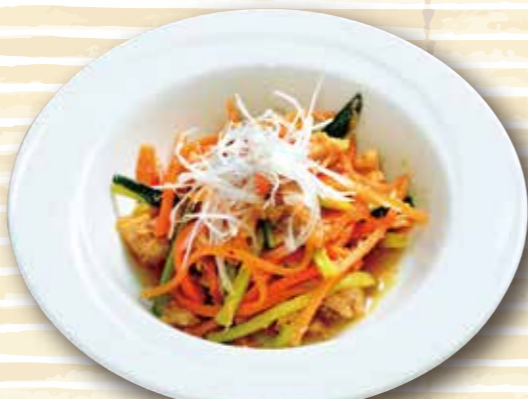
鶏むね肉の シャキシャキサラダ 510円 (税込561円)