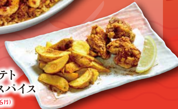
チキン&ポテト ケイジャンスパイス 660円 (税込726円)