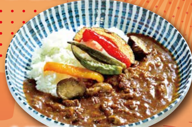
牛すじ夏野菜カレー 1,090円 (税込1,199円) ごはん大盛り +50円 (税込+55円)