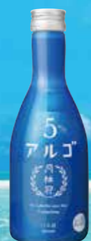
アルゴ 300ml 450円 (税込495円)