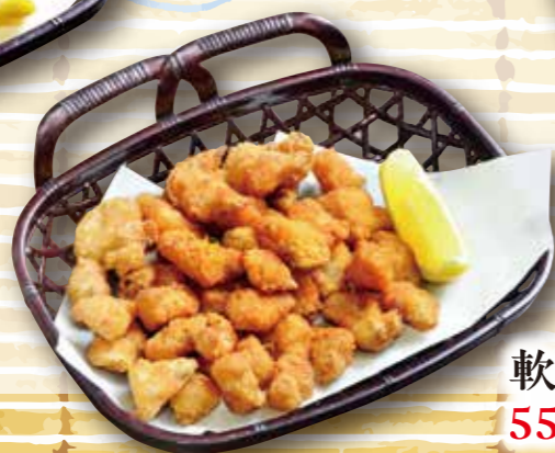
軟骨唐揚げ 550円 (税込605円)