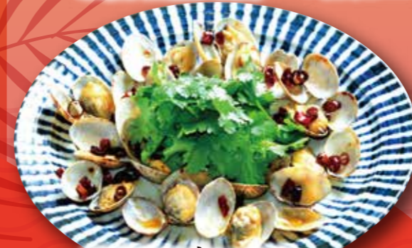
アサリの辛い ためパクチー添え 980円 (税込1,078円)