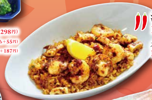
海鮮ジャンバラヤ 1,190円 (税込1,309円) 大盛り 1,390円 (税込1,529円)