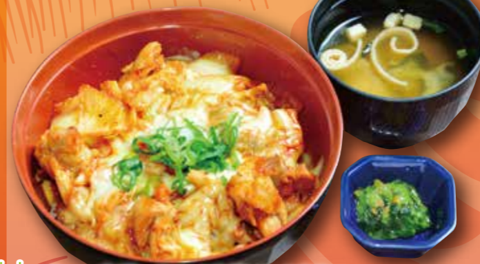
チーズダッカルビ丼 1,180円 (税込1,298円) ごはん大盛り +50円 (税込+55円) 味噌汁を麺類に変更 +170円 (税込+187円)