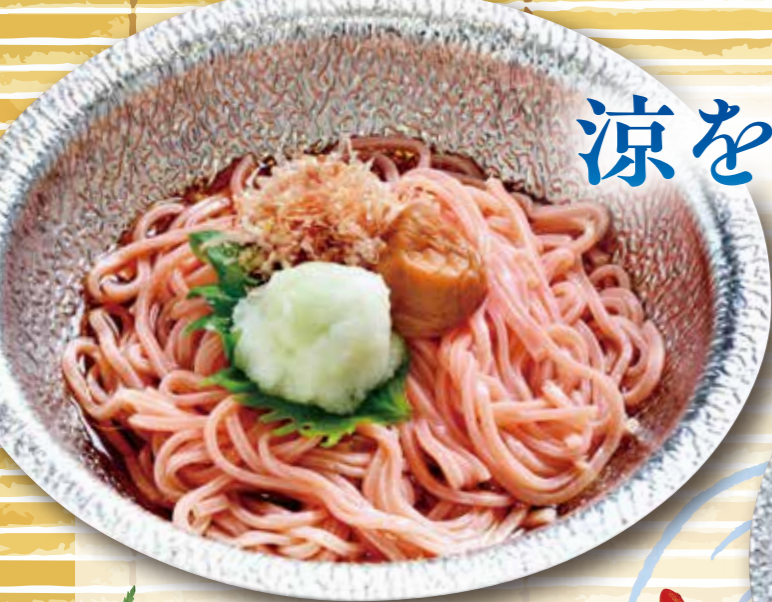
幸梅しそ冷うどん 850円 (税込935円) 麺大盛り +140円 (税込+154円)