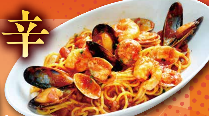
4種の魚介のペスカトーレ 1,410円 (税込1,551円)