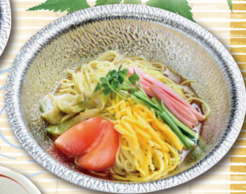
冷やし中華 ※写真は醤油ダレです。 (ゴマダレor醤油ダレ) 890円 (税込979円) 麺大盛り +100円 (税込+110円)