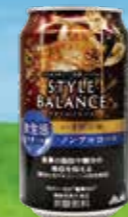
ハイボールテイスト 260円 (税込286円)